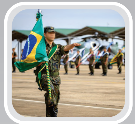
BANDEIRA PARA DESFILE