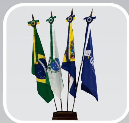
CONJUNTO DE BANDEIRAS