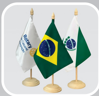
BANDEIRA DE MESA