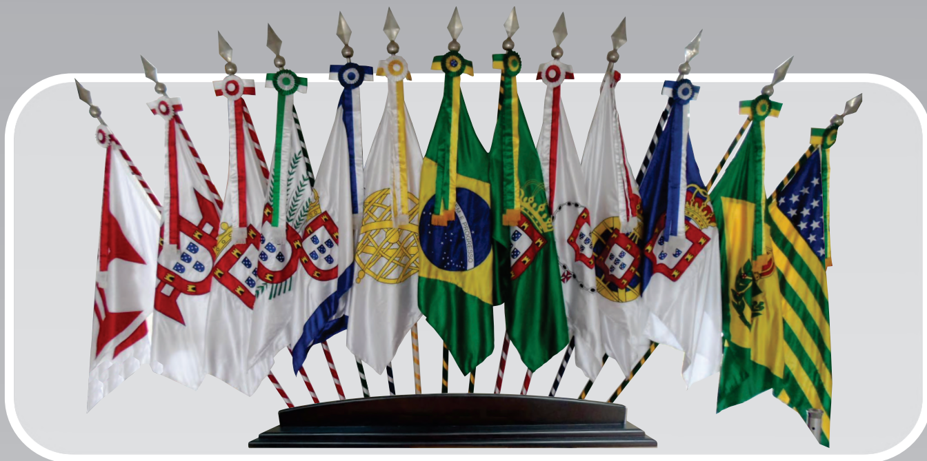
CONJUNTO DE BANDEIRAS HISTÓRICAS