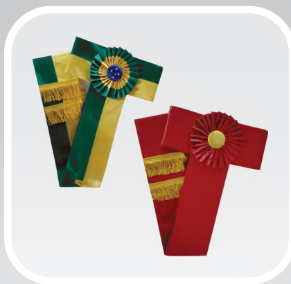
LAÇO COM ROSETA